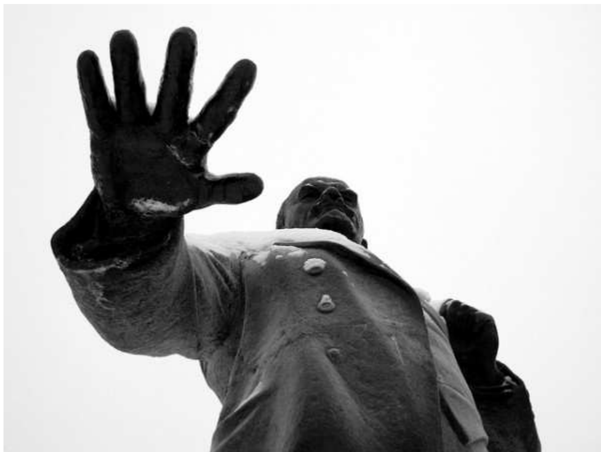
Standbeeld Lenin

Twee nieuwe boeken, allebei gebaseerd op research in de archieven van de geheime diensten van het voormalige Oostblok, geven een verbijsterend en ontluisterend beeld van de activiteiten van de communistische inlichtingendiensten op Belgisch grondgebied tijdens de Koude Oorlog. De gevreesde Oostblokspionnen hebben weliswaar een paar successen geboekt, maar toch waren ze vooral prutsers en klungelaars die hun tijd verdeden met onbenulligheden.